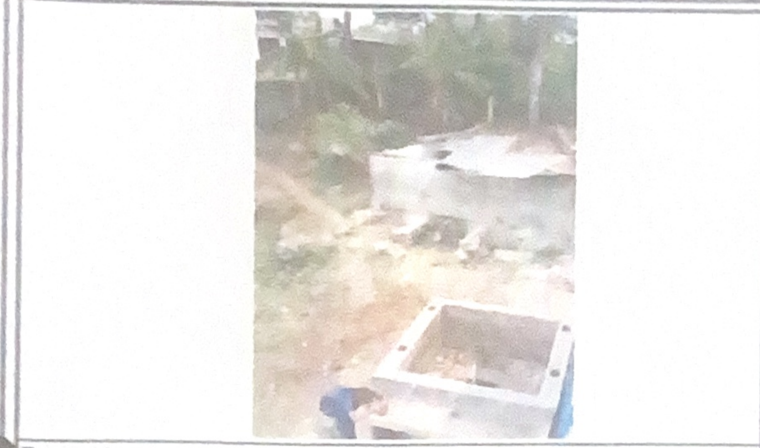
Reparación y mantenimiento de sistemas, depósitos de agua