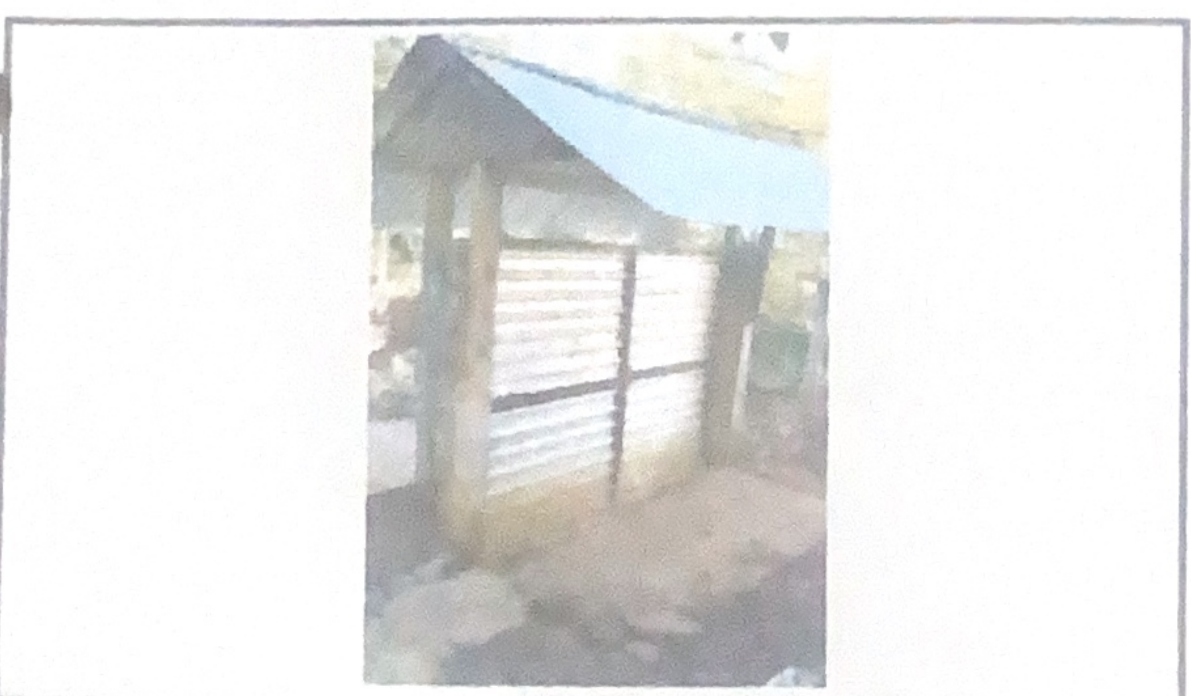
Cambio de puerta principal y entachado.