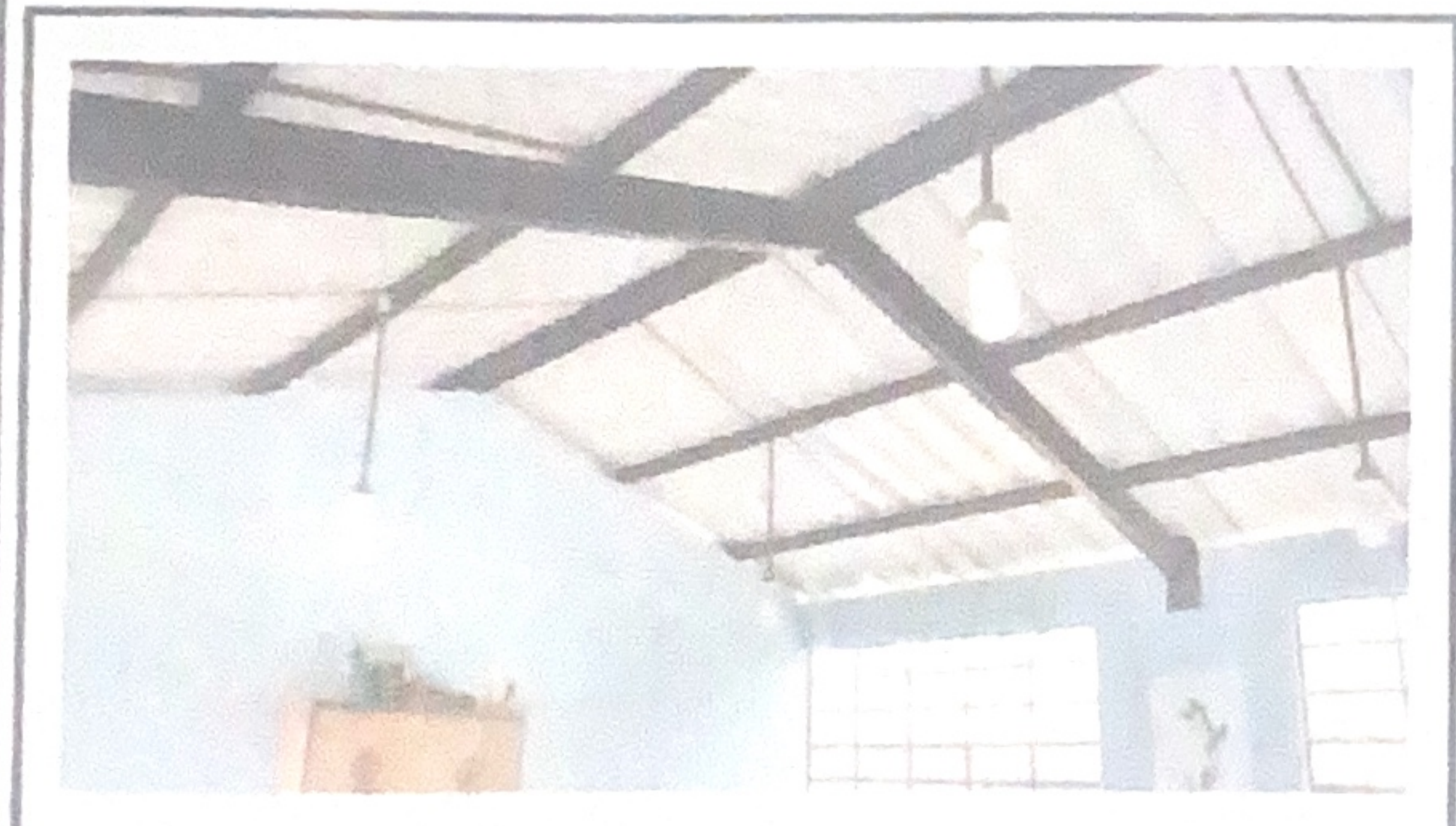
Cambio de sistema eléctrico, primer nivel y segundo nivel.