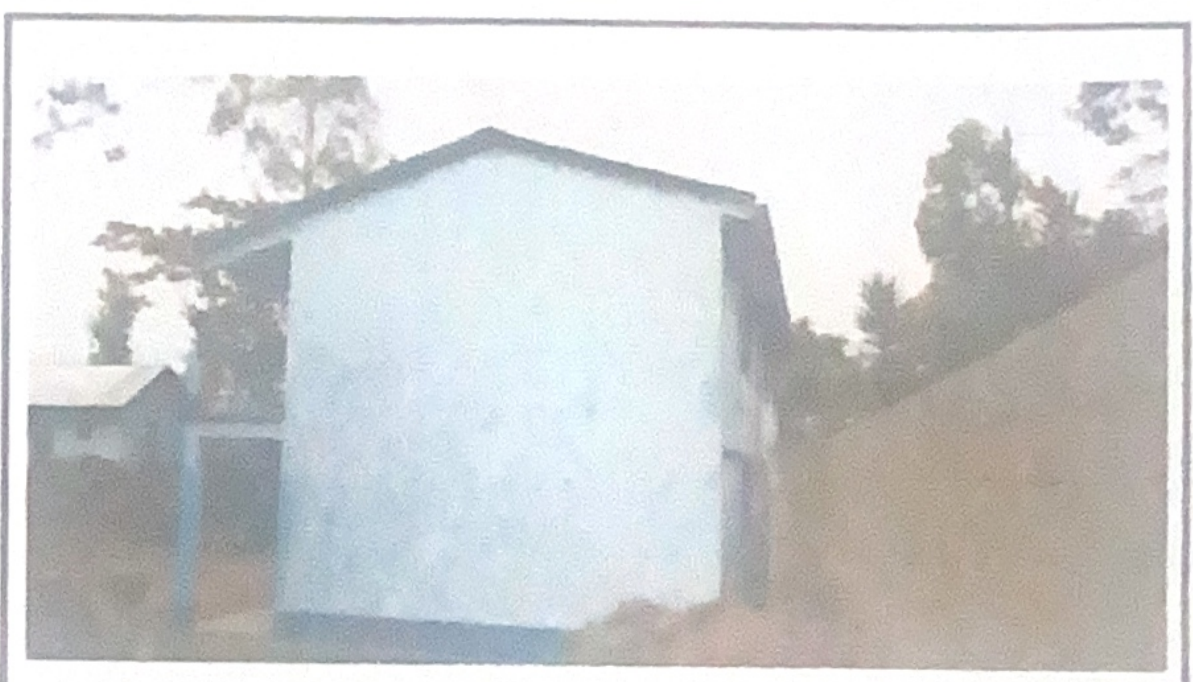
Pintar la escuela exterior e interior, primer y segundo nivel.