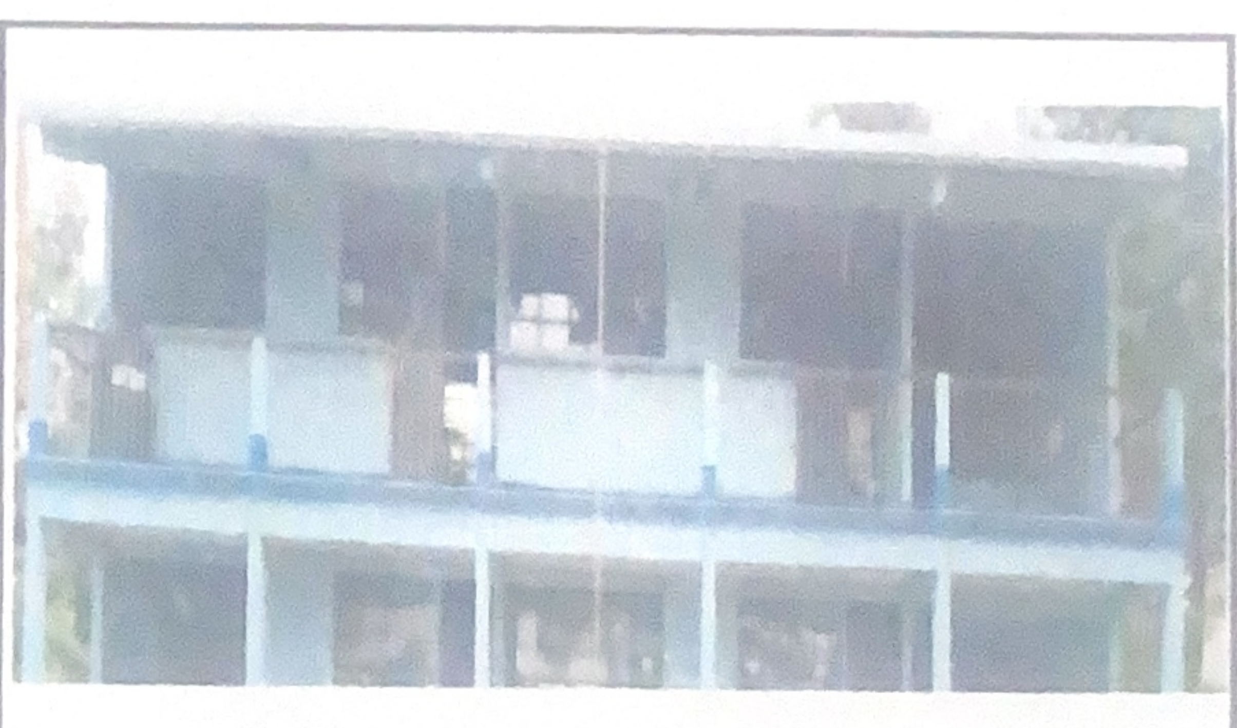
Cambio de canal.

Observación: Si es necesario se pueden agregar hojas adicionales al número de hojas.